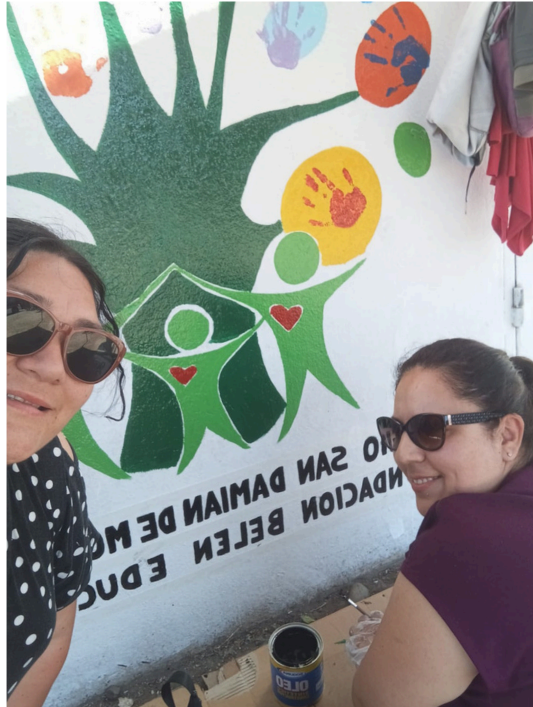
COLEGIO SAN DAMIÁN DE MOLOKAI "MURAL DE LA SANA CONVIVENCIA"