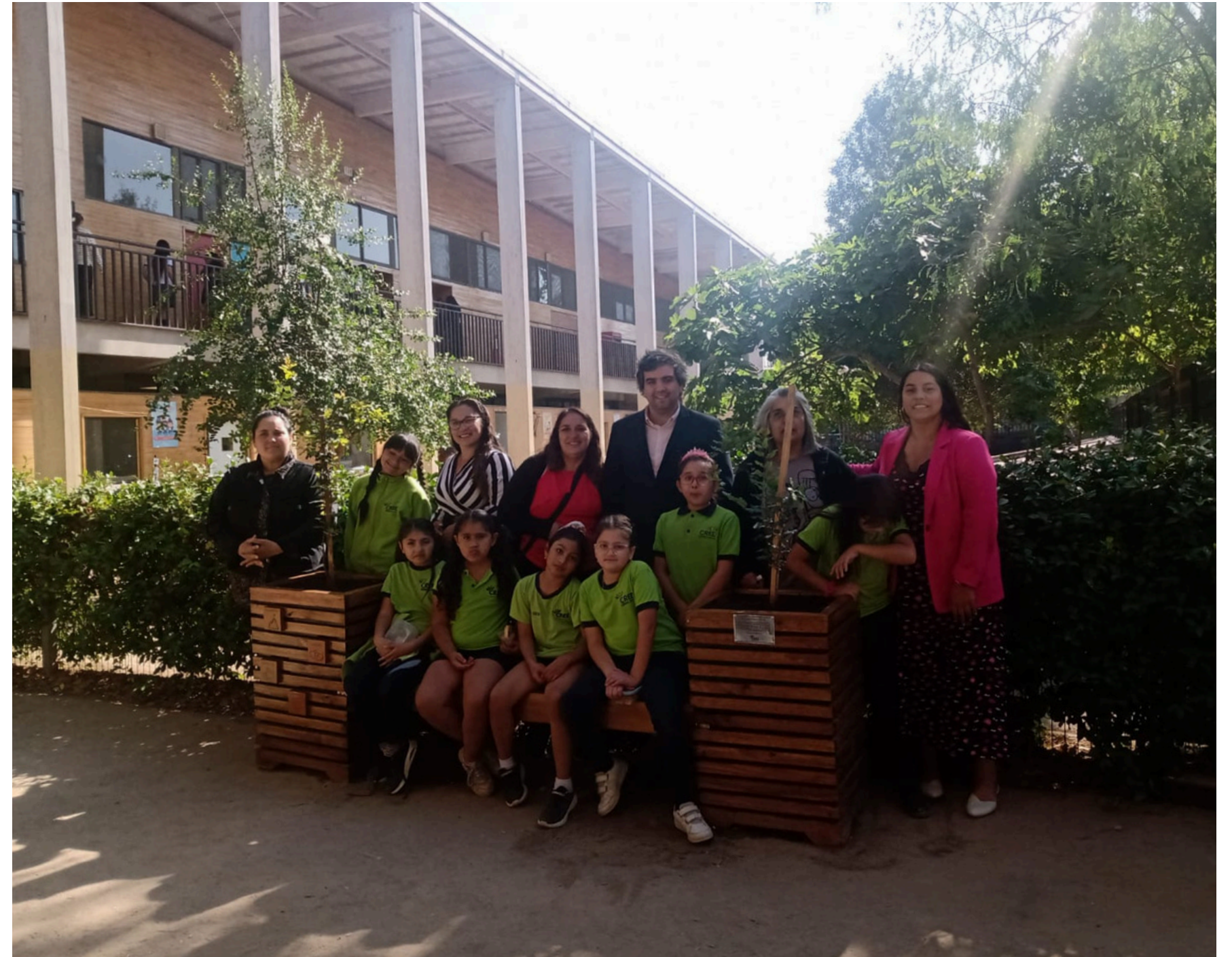
COLEGIO CREE "BANCA DE LA AMISTAD"